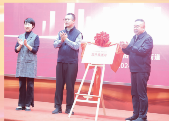
“向前一步走”双井直播间揭牌