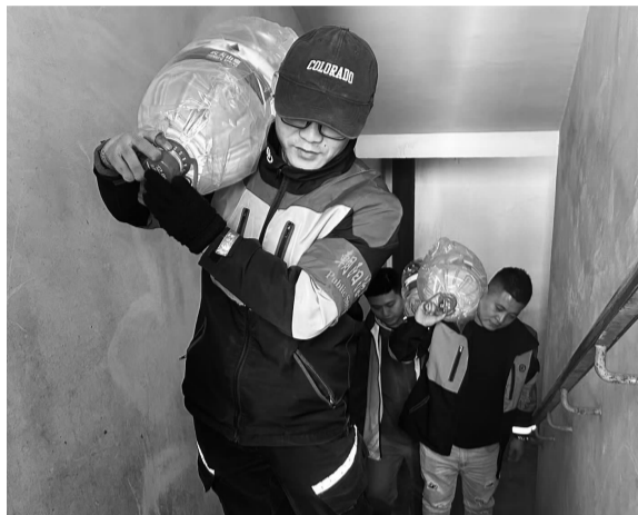
▲志愿者为特殊群体上门送水