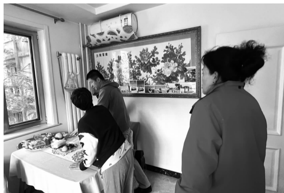
▲社区上门查看居民家供暖情况

暖的号码。令他意想不到的是,垂东社区的工作人员不仅迅速接听电话,还立即行动起来,第一时间联系了供暖公司,共同上门探访,实地查看供暖情况。