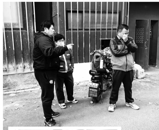
▲社区现场查找适合接线的电箱