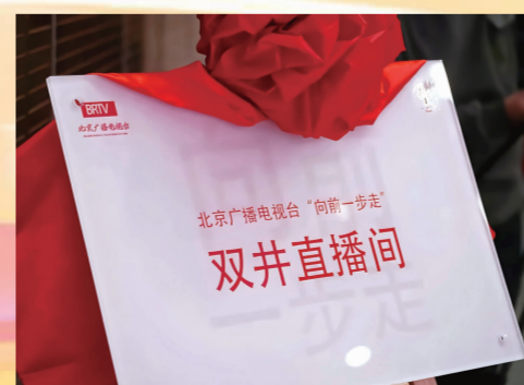
“向前一步走”双井直播间

《向前一步》作为全国首档市民与公共领域对话的金牌民生节目,至今播出已近6年,栏目聚焦民生痛点,搭建市民与政府的对话桥梁,通过营造平等、客观、公开的交流场域,让多元声音在其间碰撞,为破解城市现代化治理难题提出破解之法,不断促使首都城市治理“向前一步”。双井大课堂通过现场观摩北京卫视《向前一步》节目中反映基层最具代表性的小区治理难题的案例视频,以“沉浸式案例教学”的形式进行讲授,旨在以小区治理“小切口”破解基层治理“大难题”,在工作实践中从理念和行动上“向前一步”。